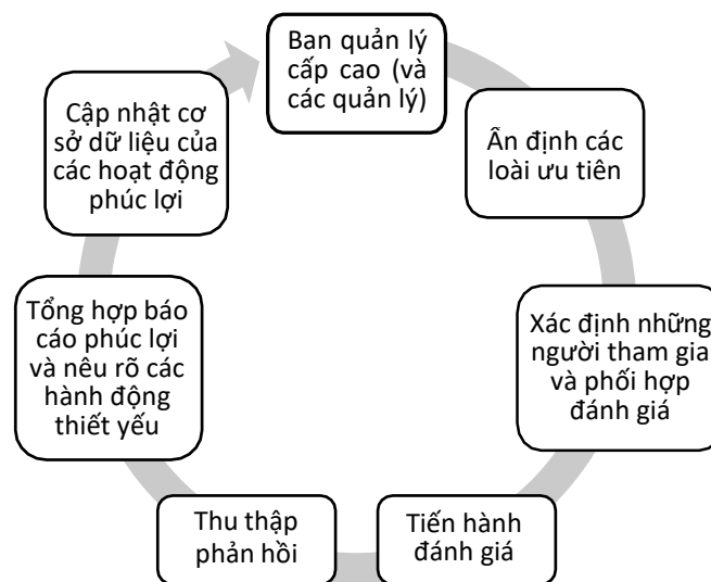
Hình 1: Quy trình đánh giá phúc lợi tại Wild Planet Trust.

Đầu tiên, các Quản lý được yêu cầu lập danh sách các loài hoặc khu bán tự nhiên ưu tiên mà họ muốn được đánh giá (xem Hình 1). Nếu không có ưu tiên nào được đưa ra, một kế hoạch đánh giá phúc lợi có hệ thống sẽ được thiết lập.