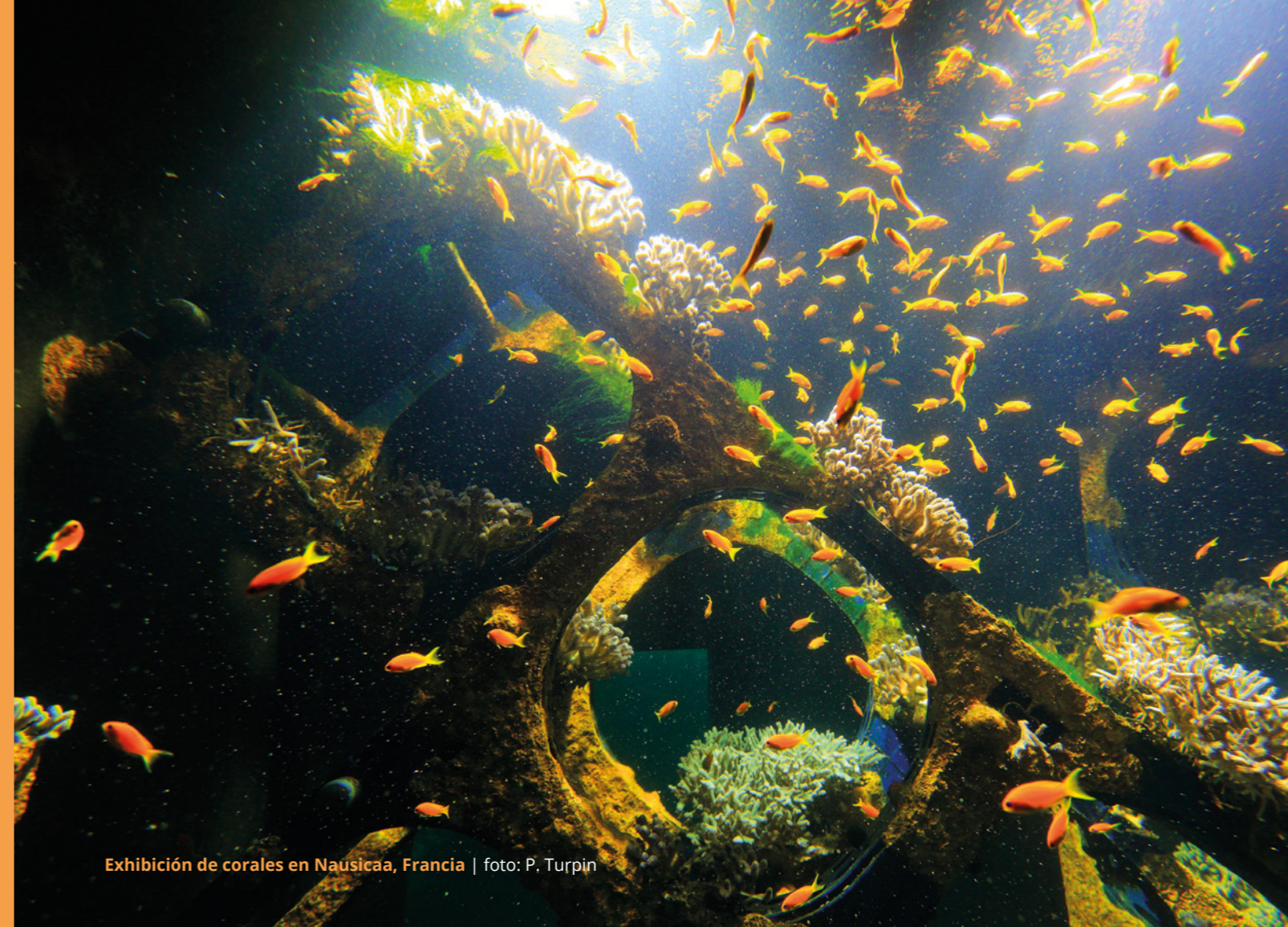
Exhibición de corales en Nausicaa, Francia