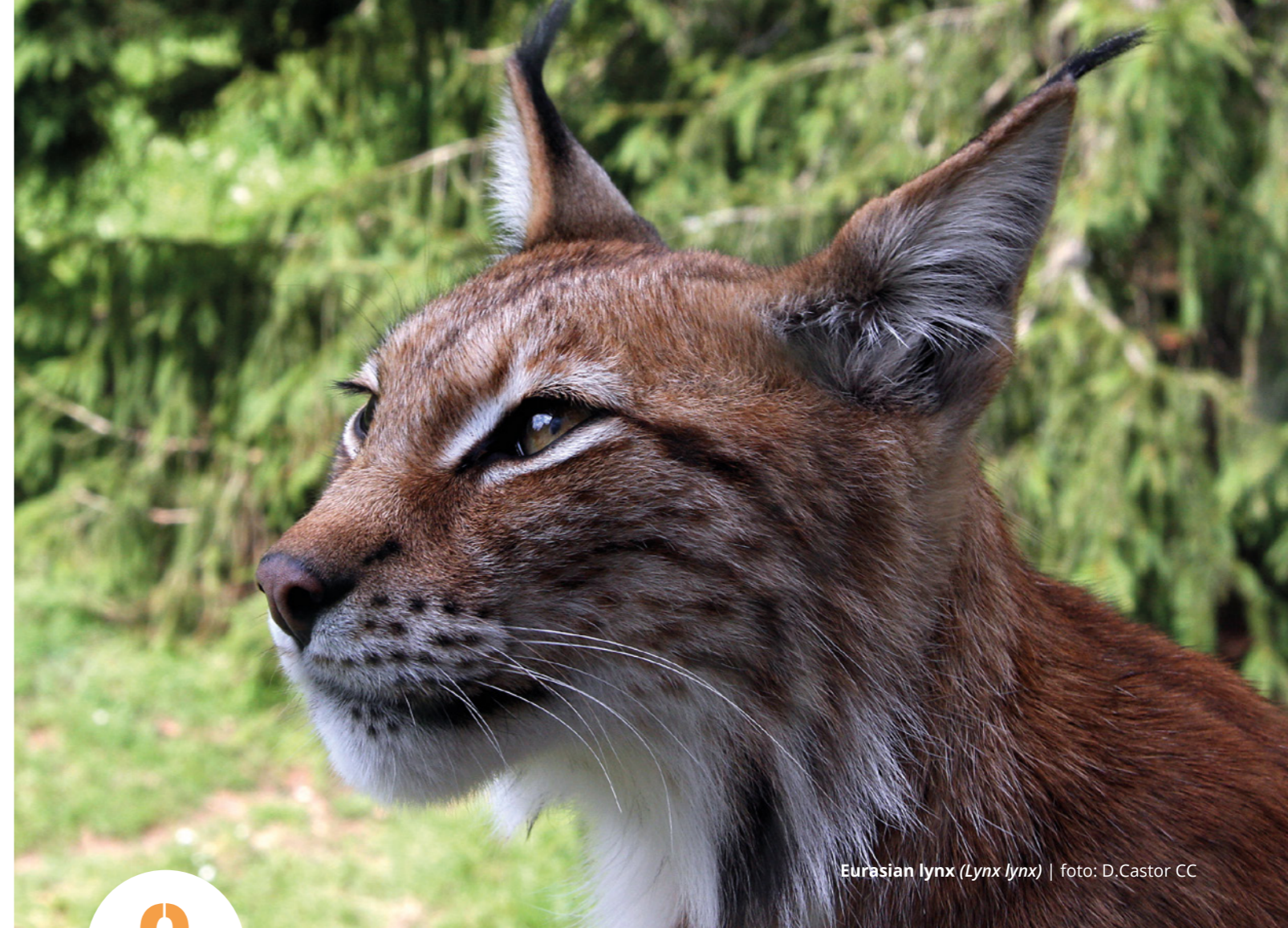
Eurasian lynx ( Lynx lynx )

EAZA reconoce que los Estados Miembros tienen diferentes oportunidades de educación y capacitación para las personas que aspiran a desempeñar trabajos dentro de la profesión de cuidador. Estamos abordando este tema a través de nuestra EAZA Academy así como nuestro Proyecto financiado por ERASMUS+ que desarrolla un marco europeo de Cualificación de Cuidador Profesional para el uso por parte de organizaciones y academias de toda Europa