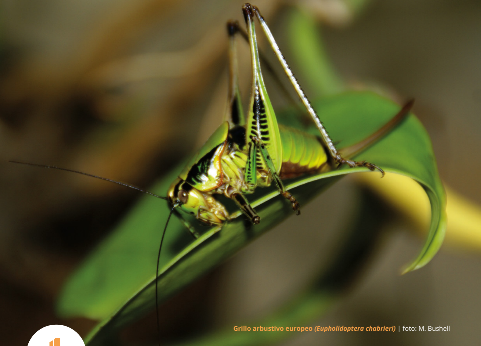
Grillo arbustivo europeo ( Eupholidoptera chabrieri )