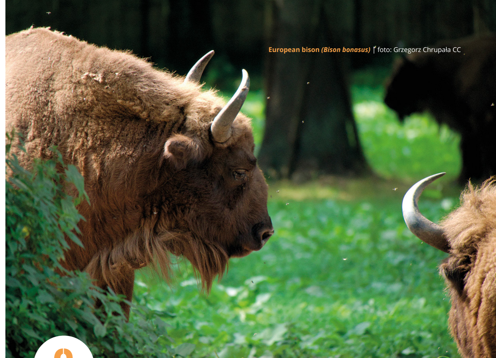
European bison ( Bison bonasus )