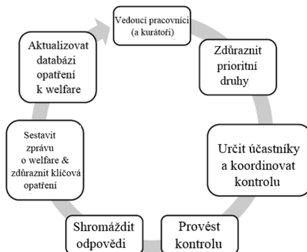
Obrázek 1: Kontrolní proces k welfare ve Wild Planet Trust

V první řadě jsou kurátoři požádáni, aby vytvořili seznam přednostních druhů nebo výběhů, u kterých chtějí, aby byly zkontrolovány (viz obrázek 1). Pokud není vytvořeno žádné upřednostnění, je navržen systematický plán kontroly welfare.