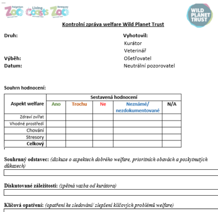
Obrázek 2: Předloha kontrolní zprávy

Na konci zprávy jsou doporučena klíčová opatření k řešení problémů welfare, na které bylo upozorněno během procesu kontroly (klíčová opatření = rozdělení úkolů na zlepšení oblastí, kde nejsou plně uspokojeny potřeby welfare).